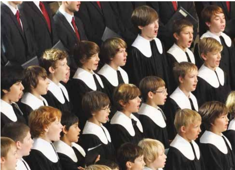
Glockenklare Stimmen in schwarz-weißen Chortalaren: die Stuttgarter Hymnus-Chorknaben

Nach einer Stunde Probe entlässt der Chorleiter seine Schützlinge in die Pause. „Ich probe jetzt mit den Instrumentalisten, und anschließend proben wir alle zusammen“, erklärt er ihnen. Draußen auf dem Flur singen die Hymnusianer an diesem Abend dann