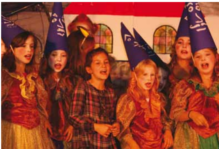
Blühende Kinderchorlandschaft – im Bild: Kinderchor der Cannstatter Steiggemeinde

Wir tragen unsere Anliegen sowohl Behörden und Ämtern als auch Politikern, und natürlich auch Institutionen und Förderern vor. ■