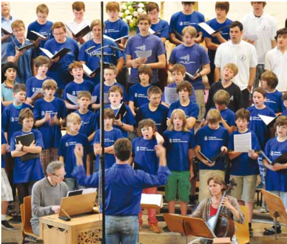
Hymnus blau-weiß während der Aufnahme der Weihnachts-CD

Die Kölner sind Spezialisten auf traditionellen Instrumenten wie Zinken, Posaunen, Violone, Chitarrone. Im Zusammenspiel mit ihnen sind die Chorknaben nun ganz bei der Sache.