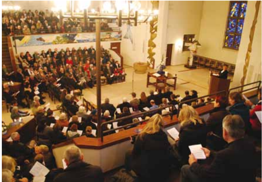
Beim Abschiedsgottesdienst war die Pauluskirche in Zuffenhausen voll von Weggefährten Wählings

Sie waren zwölf Jahre lang in der Landessynode. Warum war die Mitgestaltung auf dieser Ebene für Sie wichtig?