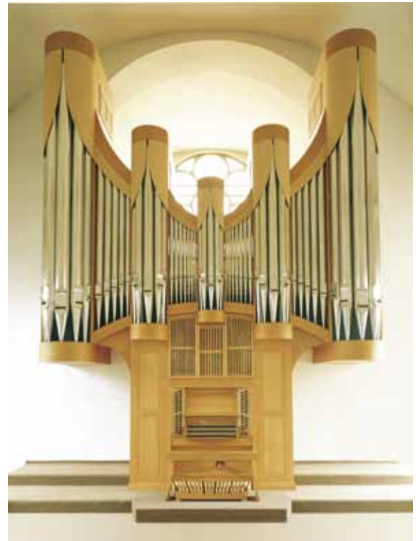
Dank Spenden erweitert: Orgel der Pauluskirche Zuffenhausen

Daneben gibt es, wie in Zuffenhausen, Aktionen für aktuelle Vorhaben. In Weilimdorf und Hedelfingen konnten beispielsweise über solche Kampagnen Orgelbauten ermöglicht werden. In Möhringen wird demnächst eine Stiftung für eine neue Orgel gegründet, berichtet der landeskirchliche Fundraiser Helmut