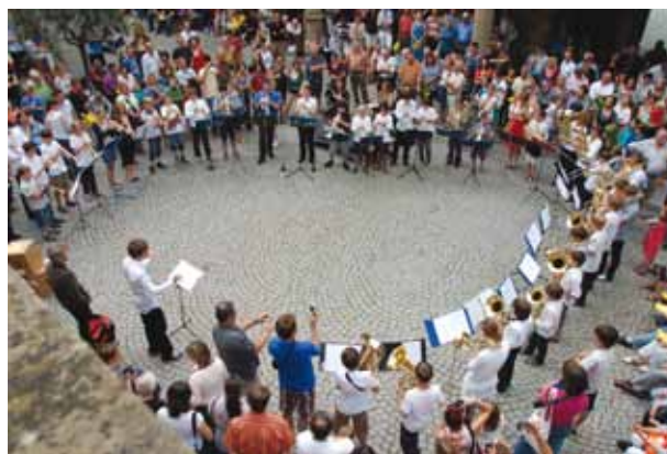
„Starkes Blech“ der Stuttgarter Bläser im Alten Schloss

260 Sängerinnen und Sänger mit. Der Projektchor der Nordgemeinde mobilisiert 150 Leute zu Bachs Weihnachtsoratorium.