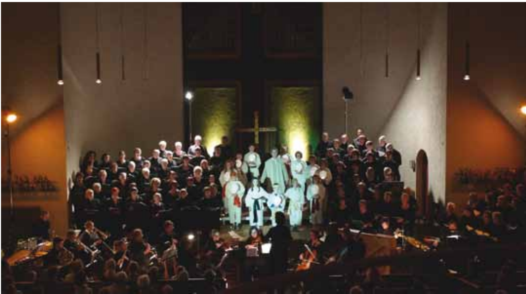
Beitrag zur Stadtteilkultur: Bei „Lebenswort“ in Hedelfingen sind Jung und Alt dabei