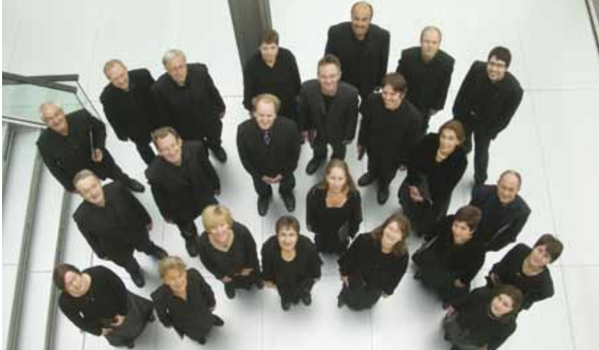
Singt regelmäßig bei „Musik am 13.“ in Cannstatt: Kammerchor Cantus Cannstatt