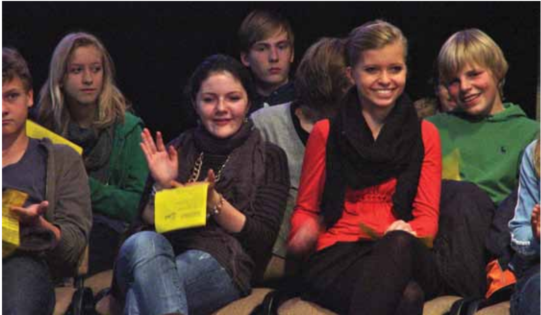
Freie Zeit ist Mangelware – Jugendliche beim Konfi-Gottesdienst in der Jugendkirche

Maichel: Es ist wirklich traurig. Wo früher Jugendliche in Gruppenräumen