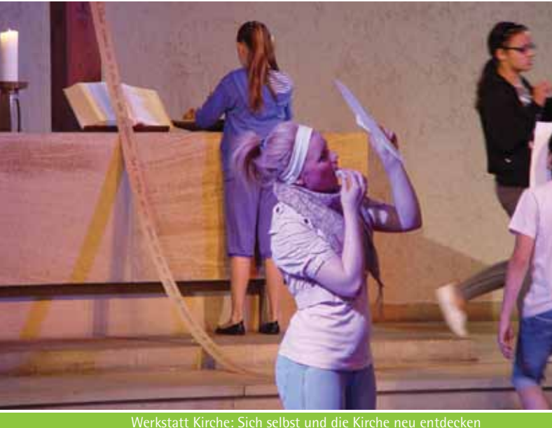
Werkstatt Kirche: Sich selbst und die Kirche neu entdecken

S ie spinnen ja – einen ganzen Tag in der Kirche, da gehe ich nicht mit, das ist doch langweilig!“ Solche Sätze bekommen manche Religionslehrerinnen und -lehrer zu hören, wenn sie ihre Klasse zu einem Werkstatttag in der Jugendkirche einladen.