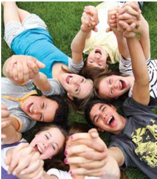
„Bunter Strauß“ Jugendarbeit

Das ehrenamtliche Engagement ist im Wandel. Zeitlich überschaubare Projekte liegen im Trend.