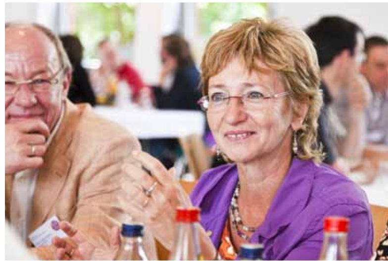
Viele Leute in lebhaftem Gespräch vertieft

„Ich bin sie doch!“, sagt eine Delegierte auf der Suche nach der Evangelischen Kirche. Der inner- und außerkirchlichen Forschung vorgegangen war ein vom Moderatorenteam vorgelegter Halbsatz: „Die Evangelische Kirche in Stuttgart nehme ich